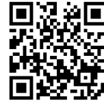
イナートサーチ/ テクニカルノート