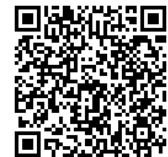
試供品申込みフォーム