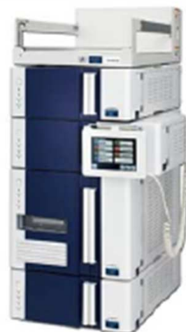
高速液体クロマトグラフ Chromaster (写真はDADシステム。組み合わせはご相談ください。)