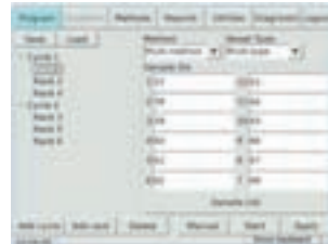
各容器に対応するメソッドを選択

1 ~ 12 本の各分解容器それぞれに、あらかじめ設定しておいた分解プログラムを割り当てるだけで簡単にメソッドを設定できます。