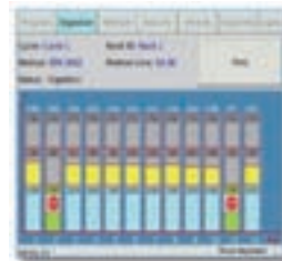
各検体の温度は常時モニター

分解動作中の試料分解液温度は各検体ごとに常時モニターされています。個別にモニターされている温度と、各プログラムで設定された温度はマイクロ波出力を制御することで正確に調整されます。