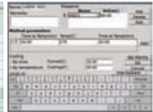
専用 PC は不要