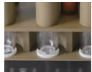
試料の状態は視認できます

注) PTFE チューブ使用時は、目視できません。また、冷却時間は、室温などの影響により前後します。