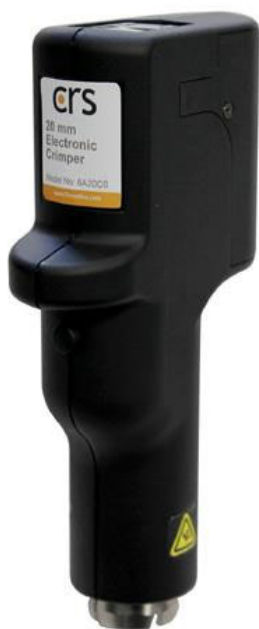
オートクリンパー