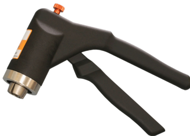
ハンドクリンパー