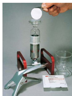
ディスクをセット コンディショニング

下記にラドディスクの一般的な操作方法を記載します。(各ラドディスクにより、実際の操作手法は若干異なります) 各ラドディスクの詳細な使用方法または技術資料につきましては、最寄りの支店または営業所までご連絡ください。