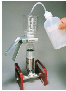
妨害を洗浄処理 核種を単離