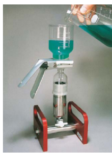
試料通液 50 mL/min