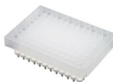
96 ウェルプレートタイプ

・卓上遠心機(例:回転数6000 rpm) 約2分で精製可能。0.4 mg(負荷量) までの精製に適用します。