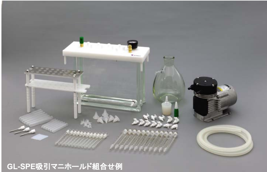
GL-SPE吸引マニホールド組合せ例