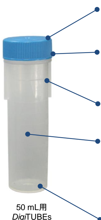
50 mL用 DigiTUBEs

注2) DigiTUBEは洗浄済みではありません。必要に応じて洗浄を行なったからの使用を推奨します。