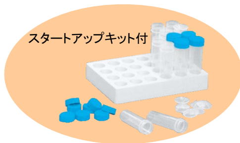
スタートアップキット付

これから酸分解を行われるお客様向けに、ヒートブロック型加熱システム DigiPREP Jr. 、キーパッドコントローラー、スタートアップキットがセットになった便利な、 DigiPREP Trial System を用意しました。