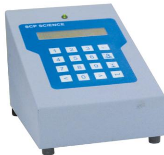
キーパッドコントローラー